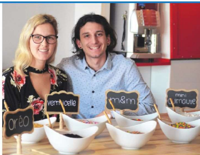
Il est possible pour les gens intolérants au lactose de manger du tofu glacé du bar laitier.